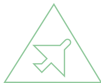
Asistencia en Viaje